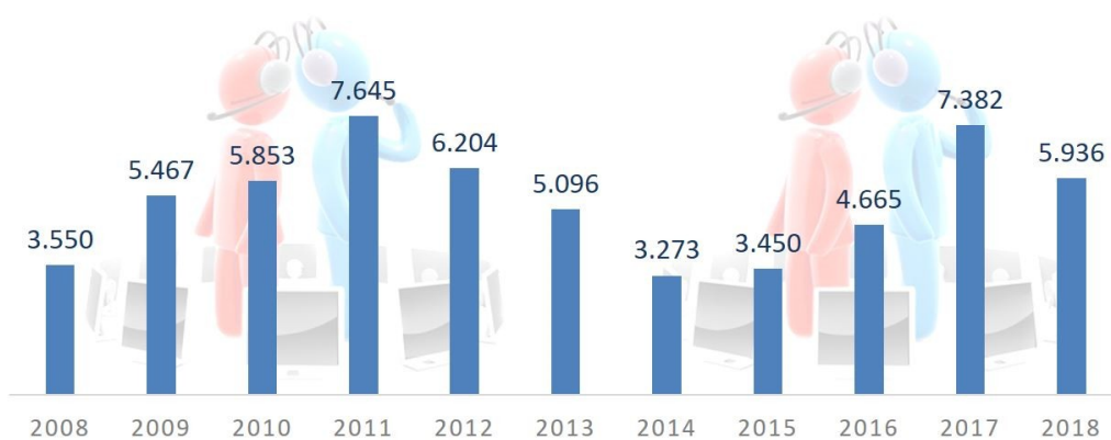
Evolución de las peticiones de trabajo

Se han atendido un total de 5.936 peticiones de trabajo.